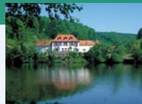
Würzbacher Weiher mit Annahof

16,8 km: Links taucht der Sägeweier auf. Hinter dem Sägeweier, direkt links, über den Weierdamm, dann rechts, Richtung Niederwürzbach weiterfahren.